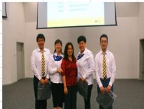
六西格玛黑带培训