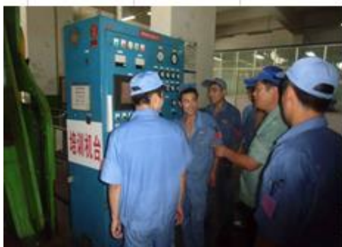
关键岗位主机手现场培训