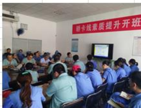
班组长素质提升培训